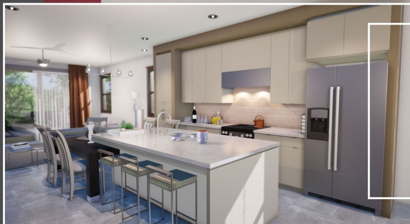
Ilustração interna planta Salerno