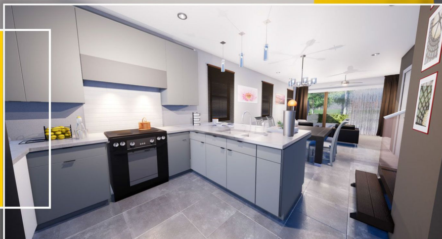
Ilustração interna planta Amalfi

Modelo Amalfi corresponde a unidade de esquina