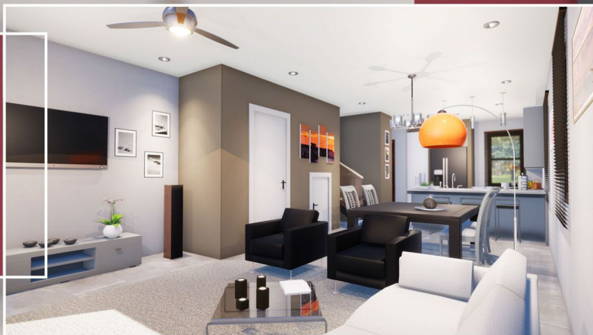
Ilustração interna planta Tramonti

Modelo Tramonti corresponde a unidade interna