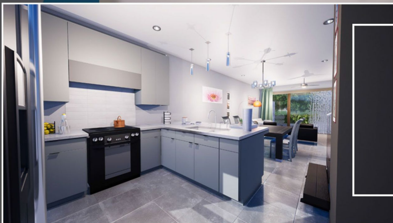
Ilustração interna planta Sorrento