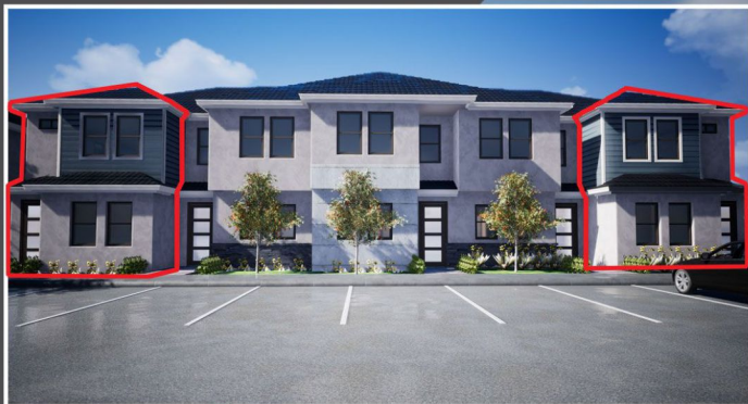
Modelo Salerno corresponde a unidade de esquina